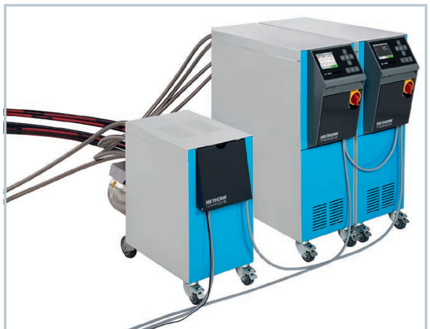
Bild 1. Zum variothermen Temperieren von Werkzeugen kommen bei HB-Therm zwei Temperiergeräte Thermo-5 zum Einsatz, die über die Umschalteneinheit Vario-5 mit Maschine und Werkzeug verbunden sind

In all diesen Anwendungsfällen ist im Idealfall die Formnestoberfläche im Werkzeug beim Einspritzvorgang „warm“ und in der Abkühlphase „kalt“. Das Werkzeug oder auch nur der kavitätsnahe Bereich werden eine bestimmte Zeit aufge-