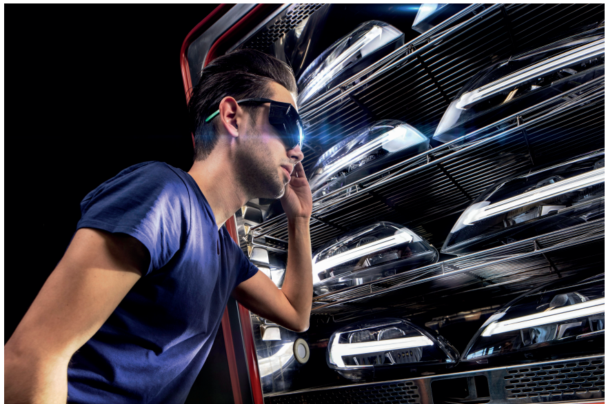
Bei ZKW entstehen sowohl komplette Lichtsysteme als auch alle notwendigen Komponenten wie Streu- und Abdeckscheiben oder die zugehörige Elektronik