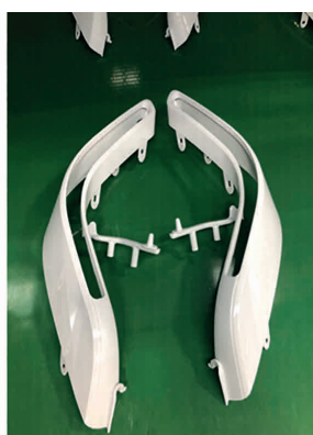
Bild 2. Im Klartext: Auf dem Bildschirm eines Thermo-5 mit Eco-pump erscheinen sowohl Sollwert als auch Rücklauftemperatur, die Durchflussmenge sowie die aktuelle Leistungseinsparung und die insgesamt eingesparte Energie pro Gerät (links). Die Werte zur Leistungsoptimierung wurden während eines Versuchs zur Serienfertigung einer Blende (rechts) in Wieselburg ermittelt

so Benedikt, der gesamte Herstellungsprozess ist nur so gut wie seine Einzelkomponenten.